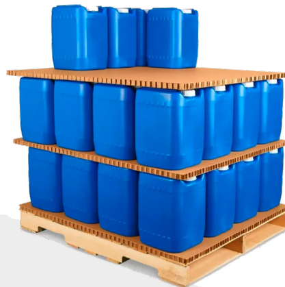
Lámina tipo panel