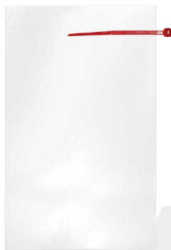
Bolsa con cincho