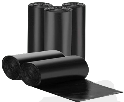
Hule negro de 1 a 7 m