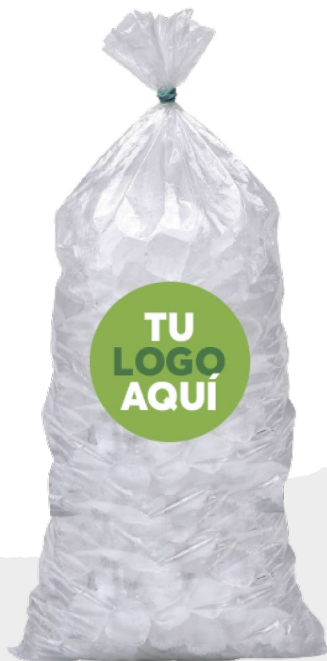
Bolsa para hielo 10 kg