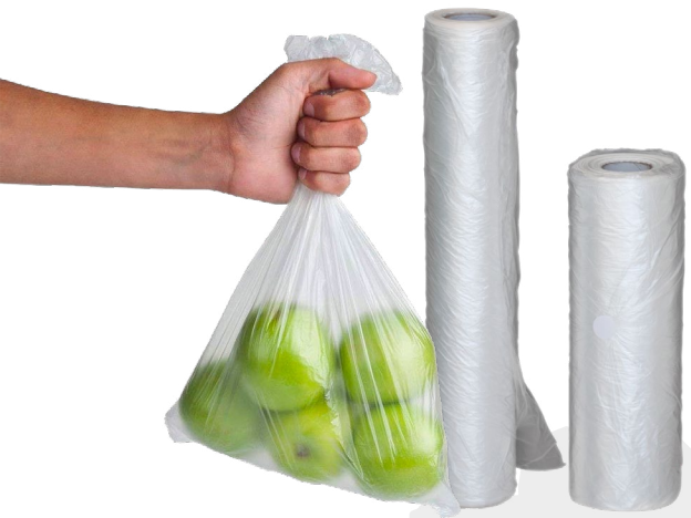
Bolsa para verdura