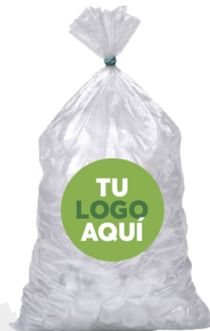
Bolsa para hielo 5 kg