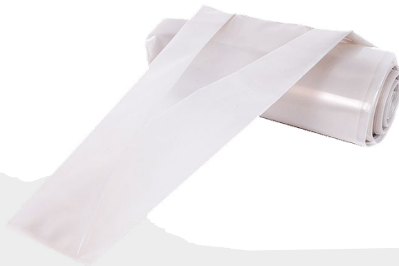
Bolsa para barreno (Voldaduras)