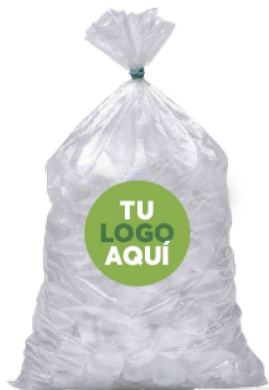
Bolsa para hielo 3.6 kg