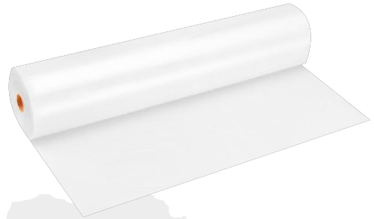
Rollo de polietileno