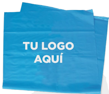
Bolsa para empaque