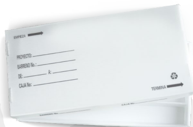
Caja de polipropileno para núcleo NQ, HQ, PQ y BQ