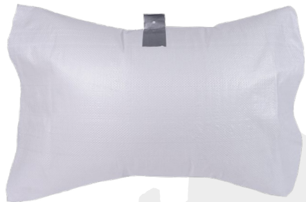
Bolsa de gas (Voladuras)